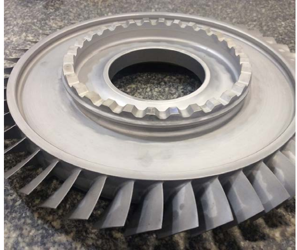
이후: 완성된 블리스크