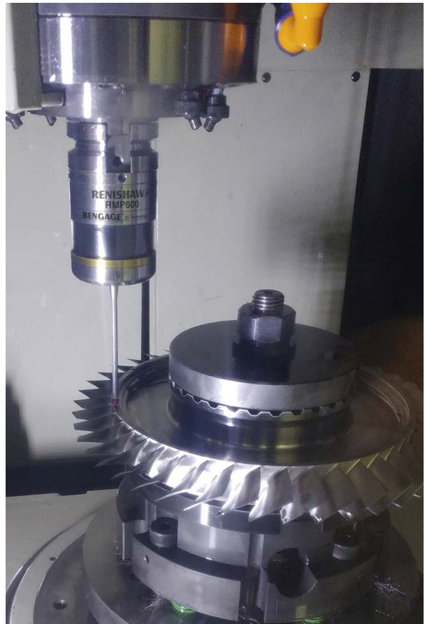
Renishaw의 RMP600 고정밀 접촉식 프로브