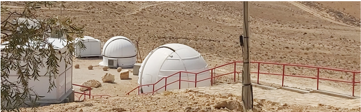
이스라엘 남부 네게브 사막에 위치한 Wise Observatory

Wise Observatory는 텔아비브 대학이 소유하고 운영하는 전문적인 천문연구소입니다. 이 천문대는 텔아비브에서 남쪽으로 약 200km 정도 떨어진 Mitzpe Ramon 마을 근처에 있는 네게브 사막에 자리하고 있습니다. 1m 직경의 Ritchey-Chrétien 망원경 한 대와 자동화된 소형 망원경 여러 대, 지질 및 대기 연구용 장비를 구비하고 있습니다.