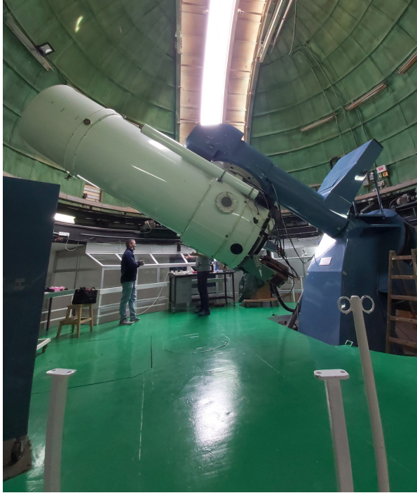
Wise Observatory의 1m 기본 망원경